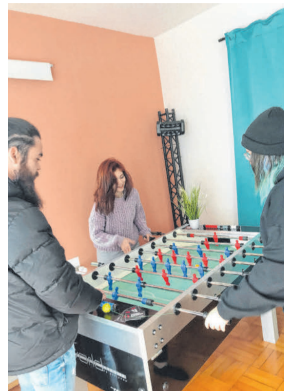
ERH Das Trio bringt sich in die Dornbirner Jugendarbeit ein.

Heimat Vorarlberg. Sie möchte durch die OJAD verschiedene Or-